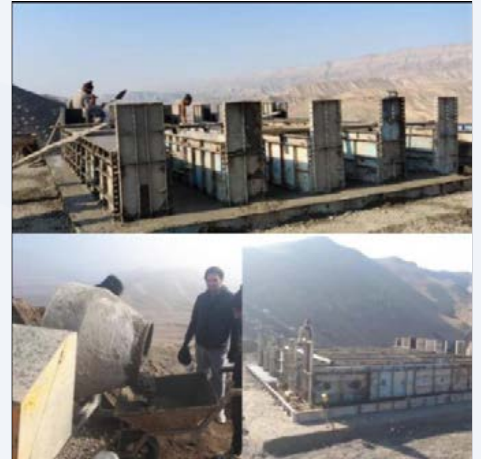
قیطان و ۲۲ خانوار روستای چنار سوخته تامین خواهد شد.